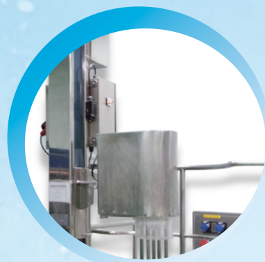
Санитарная автоматическая система