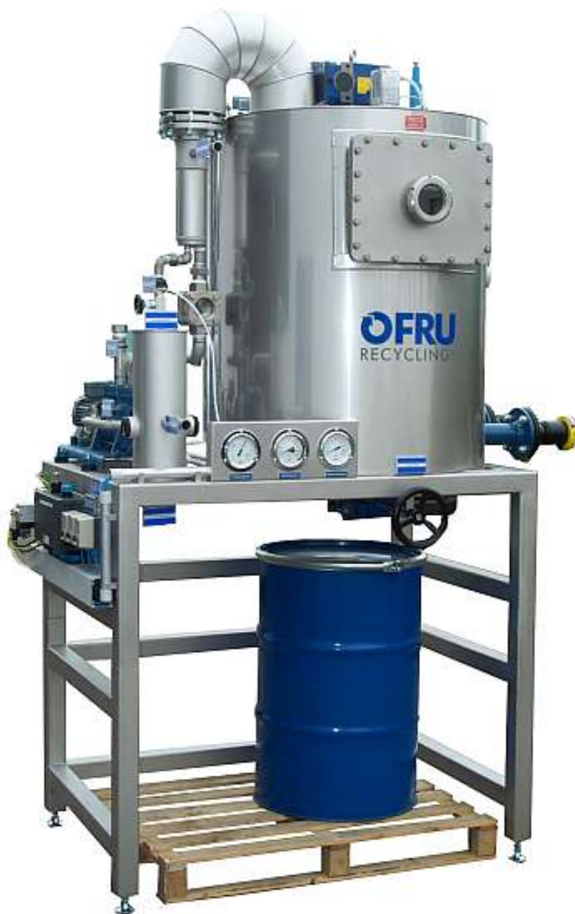
Установка ASC-300 Версия 2011, Стандартное исполнение